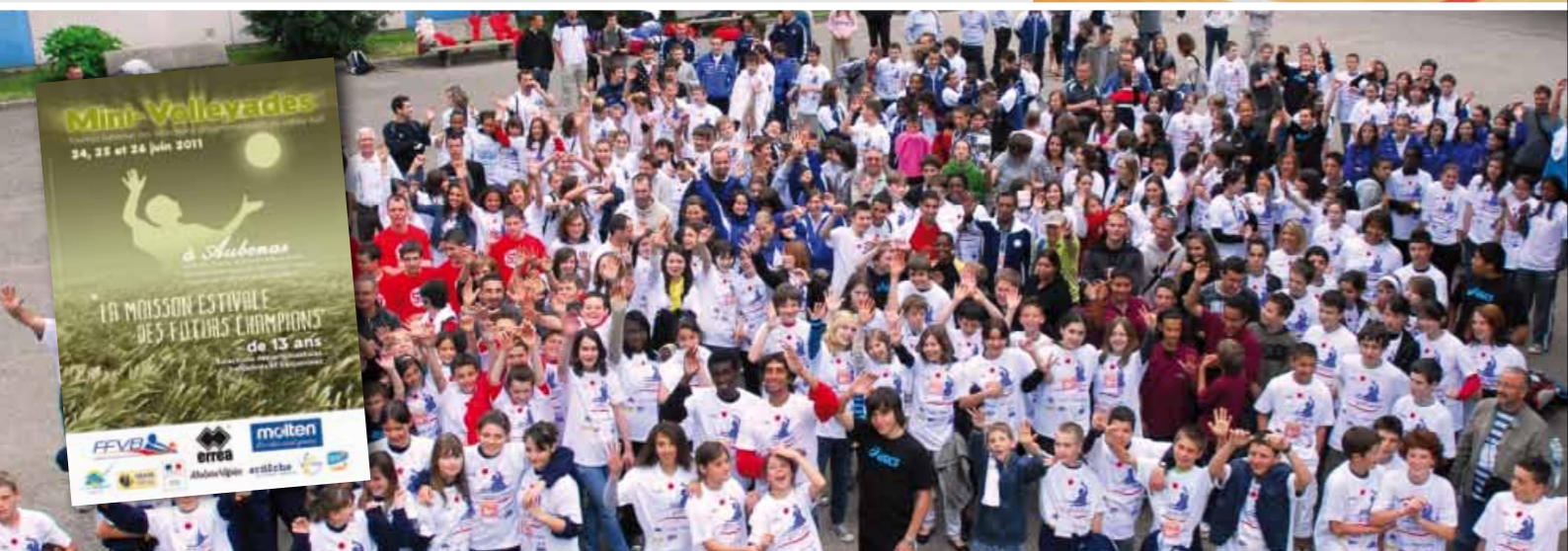
Les benjamins et benjamines lors des Minivolleyades de 2008 à Aubenas.