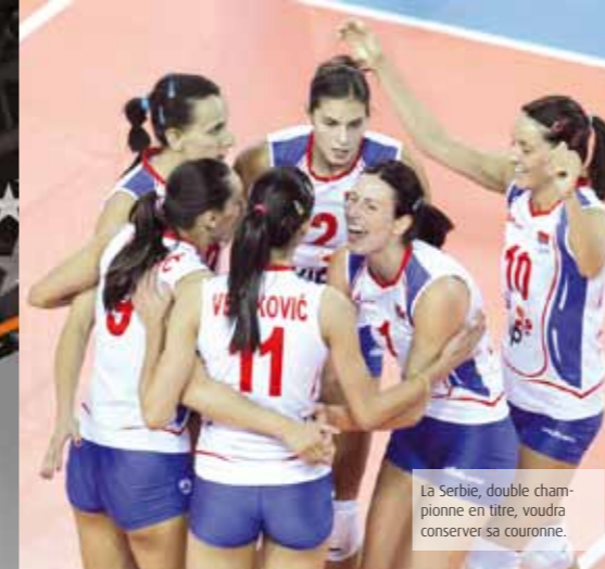
La Serbie, double championne en titre, voudra conserver sa couronne.

Lors de la 1 ère édition, l'équipe de France avait brillamment obtenu sa qualification pour le Final Four. Cette année, les Bleues n'auront pas d'autre objectif. Cependant, la lutte promet d'être âpre dans ce groupe A. Avec la Grèce, l'Espagne et surtout la Serbie, la France a hérité d'un groupe très relevé. Les joueuses serbes sont tout simplement les double tenantes du titre. Créée en 2009, la Ligue Européenne rime donc avec la Serbie qui évidemment aura à cœur de défendre sa couronne lors du Final Four d'Istanbul.