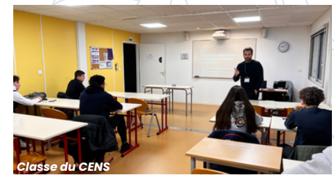
Classe du CENS