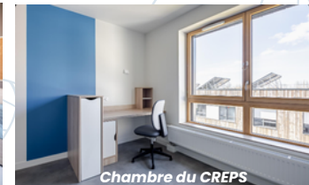
Chambre du CREPS