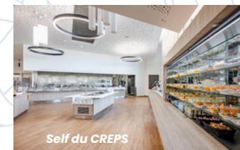
Self du CREPS