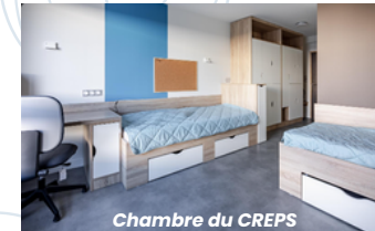
Chambre du CREPS