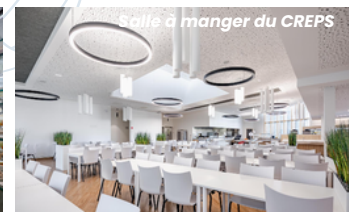
Salle à manger du CREPS